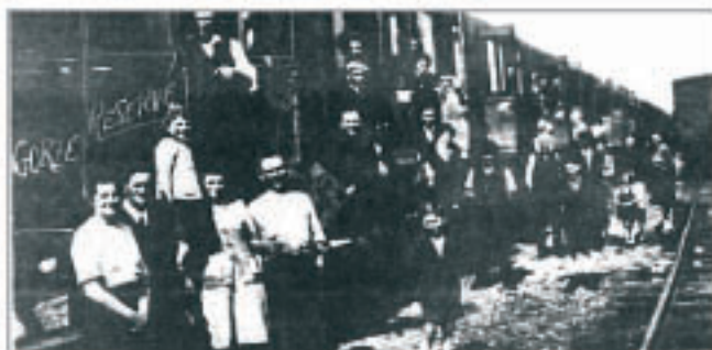
12 novembre 1940, Gare de Metz. Des wagons sont réservés aux Gorziens, car des expulsés d'autres villages (Rezorville par ex.) se trouvent là, eux aussi.